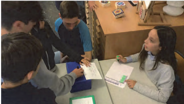
Formar-se vivint la democràcia. Alumnes votant el Consell de Govern d'una escola.