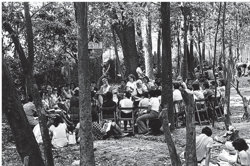
Escola d'Estiu de 1968. Educant per a la democràcia en una dictadura.